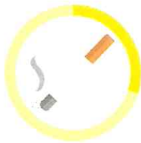
CIGARETA 3 MESAČE - 2 ROKY