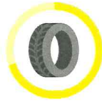
PNEUMATIKA 200 - 300 ROKOV