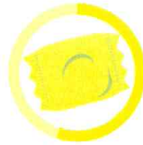
ŽUVAČKA 5 ROKOV