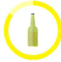
SKLO 4000 ROKOV