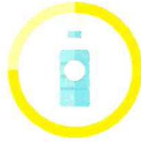
PET FLAŠE 100 - 1000 ROKOV