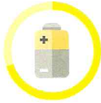
BATÉRIA 200 - 500 ROKOV