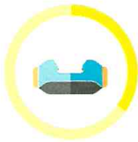
PAPIEROVÁ VRECKOVKA 3 MESAČE