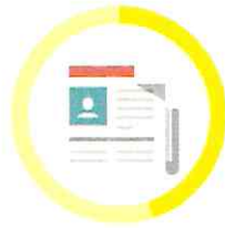
NOVINY 3 - 12 MESAČOV