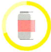
PLECHOVKA 20 - 100 ROKOV