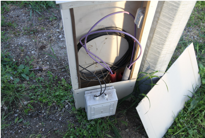
Štúrova - Školská