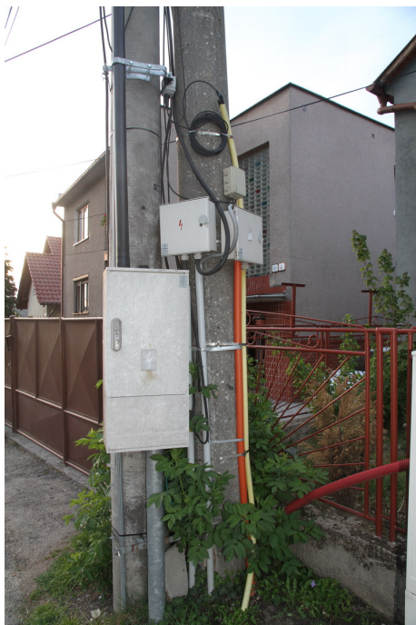
Školská - Budovateľská